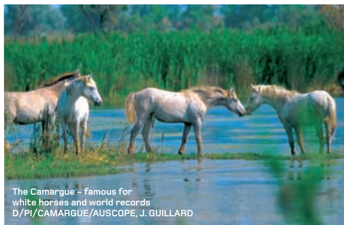
The Camargue - famous for white horses and world records

Tout ceci fut menacé par Attali lorsqu'il proposa d'autoriser tous les nouveaux chauffeurs à circuler sans licence. A cela, les chauffeurs de taxi n'ont eu qu'une seule réponse : la grève. C'est pourquoi, du moins pour l'instant, à moins d'avoir réservé votre voiture une semaine à l'avance, le serveur du restaurant reste le meilleur moyen de rentrer chez soi. Veuillez simplement à ce qu'il n'ait pas bu autant que vous.